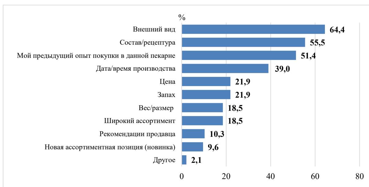
Рис. 3. Критерии выбора хлебобулочных изделий в пекарнях, %

тывается более 11 тысяч субъектов хлебопроизводства. Для российской хлебопекарной отрасли характерна высокая концентрация производственных мощностей на крупных предприятиях при одновременном функционировании большого количества малых предприятий; доля средних и крупных хлебопекарен на российском рынке составляет более 70%, а малых – около 30% [2].