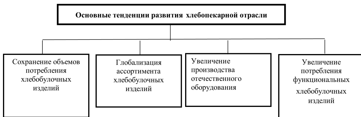
Рис. 4. Основные тенденции развития хлебопекарной отрасли России

Российской Федерации ежедневно употребляют хлебобулочные изделия. При этом, при рассмотрении более раннего проведенного исследования Всероссийским центром изучения общественного мнения, можно выявить, что у 84 % россиян хлеб и хлебобулочные изделия являются основными, а не дополнительными продуктами в рационе питания [3].