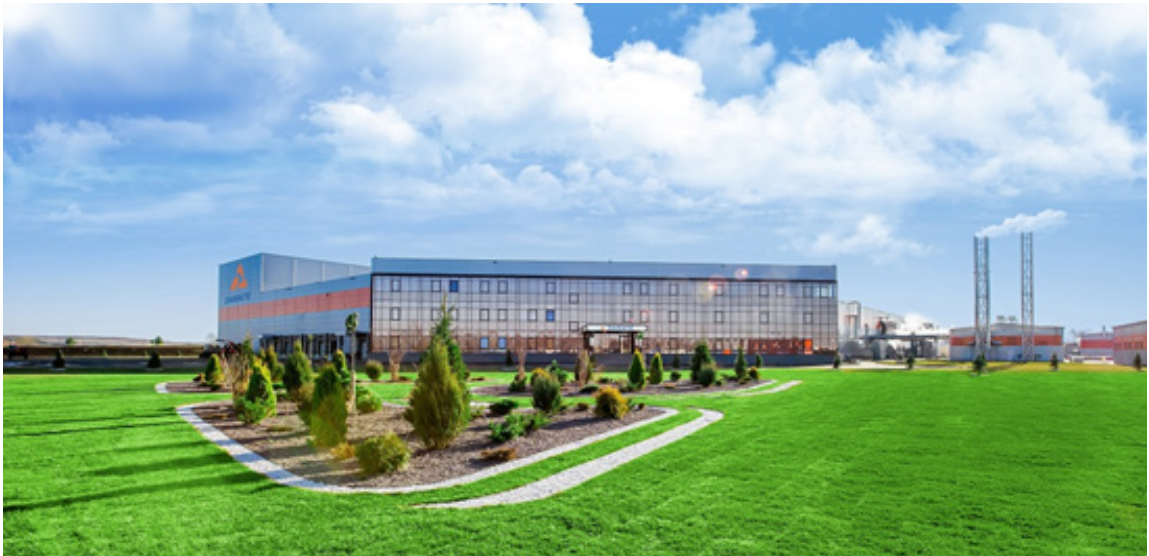
Рис. 3. Завод глубокой переработки индейки

года, что позволит увеличить производство индейки на 22,6 тысячи тонн в убойном весе в год и выйти на запланированную мощность индейководческого проекта.