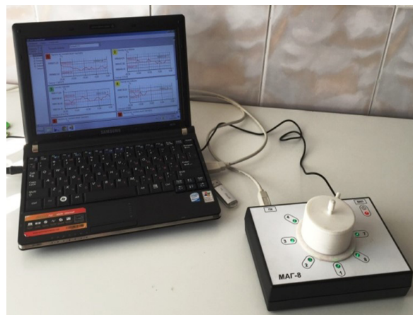
Рис. 1. Общий вид анализатора «МАГ-8»

Анализ научной литературы выявил, что сегодня весьма актуальным является разработка и создание мучных кондитерских изделий обогащенных нетрадиционными видами сырья. Так, например, разработана рецептура крекера с добавлением 15 % шрота калины обыкновенной. Установлено, что при добавлении в рецептуру 15 % шрота из ягод калины обыкновенной крекер имеет равномерный, выраженный кремовый цвет с золотистым оттенком, тонкий запах и привкус калины, гладкую поверхность. По физико-химическим показателям полученные крекеры полностью соответствуют требованиям ГОСТ 14033-2015. Полученные изде-