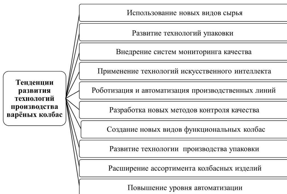
Рис.4. Тенденции развития технологий производства варёных колбас

пасность производства, а также снизить затраты на труд.