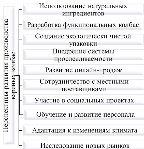
Рис. 3. Перспективы развития производства вареных колбас

Исследовано влияние шрота расторопши пшенистой на органолептические, физико-химические