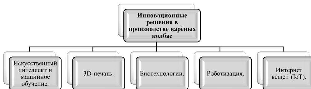
Рис. 2. Иновационные решения в производстве варёных колбас

Персонал, работающий на производстве, должен быть обучен и квалифицирован для выполнения своих обязанностей. Обучение персонала включает в себя изучение технологий производства, правил безопасности и гигиены, а также методов контроля качества.